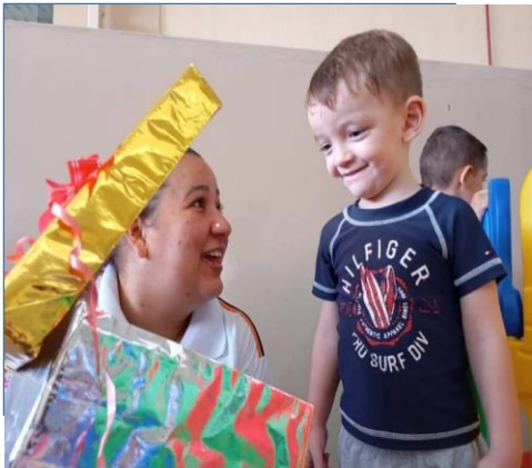
Atividade 1: Sou especial – Atividade com espelho