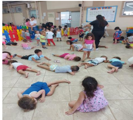
Atividade 2: : Dança de roda, seguindo os comandos da música