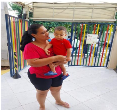
Atividade 1: Datas comemorativa/ Criança em ação - Dia do amor