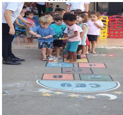
Atividade 6: Corrida da colher