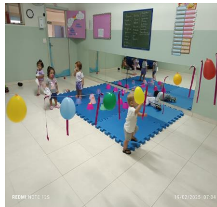
Atividade 7: Varal das fitas e bexigas