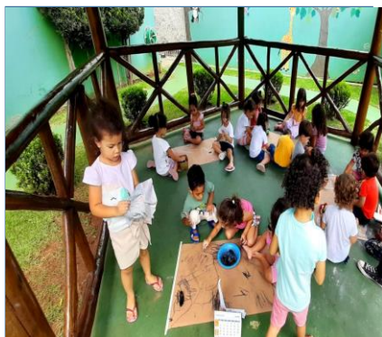
Atividade 4: Expressar