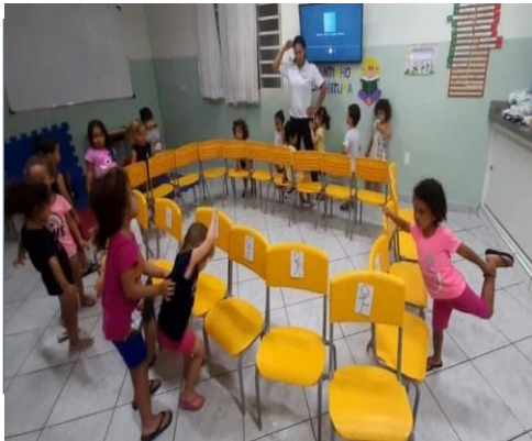
Atividade 1: Dança da cadeira com gestos e figuras