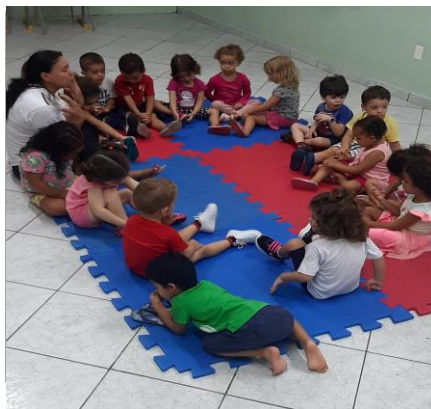
Atividade 6: Roda de conversa