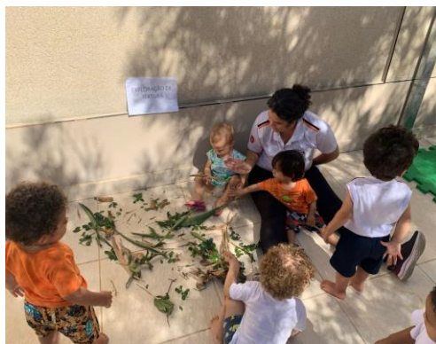
Atividade 2: Habitar e pertencer – Explorando texturas