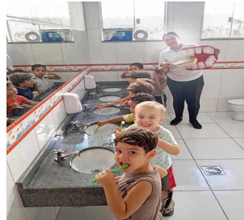
Atividade 3: Estimulando a escovação