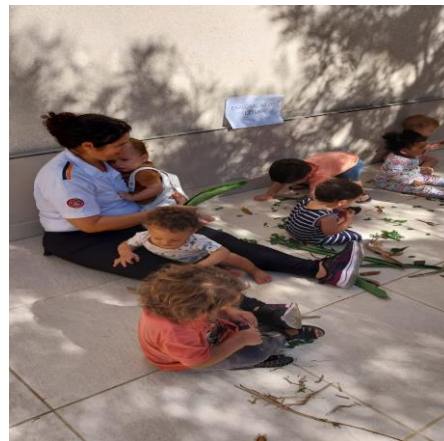
Atividade 2: : Brincadeira livre com elementos da natureza