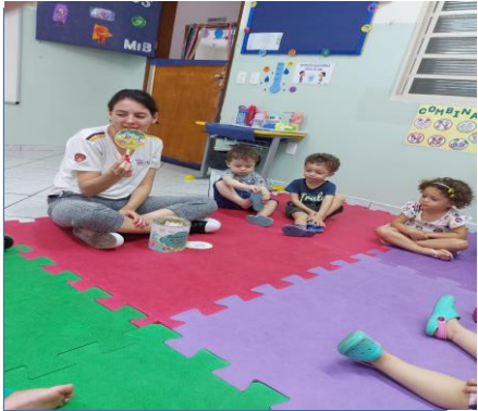
Atividade 6: Conhecer-se