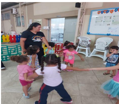
Atividade 5: Dança circular/Roda