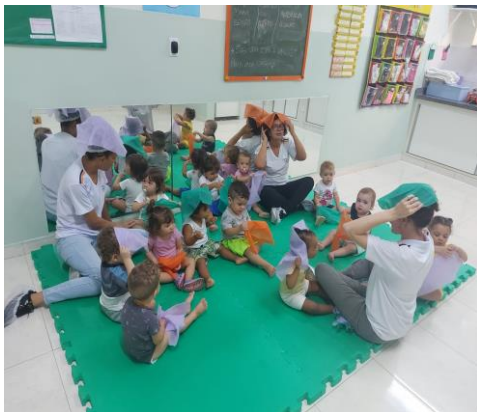
Atividade 6: Dança do lencinho