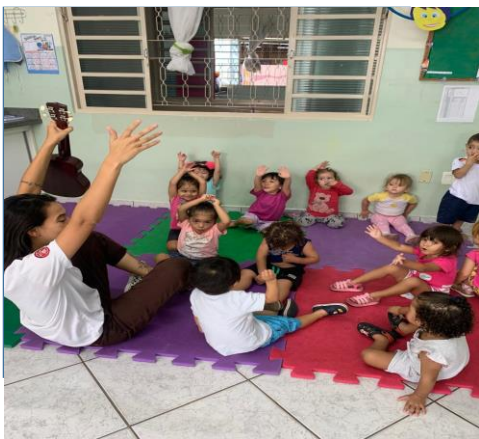
Atividade 5: Acolhendo os sentimentos – Quando eu estou feliz