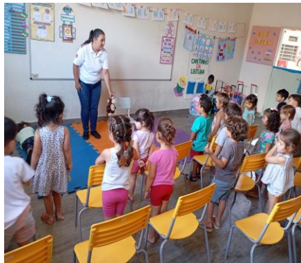
Atividade 2: Atividade de comandos(imitação)