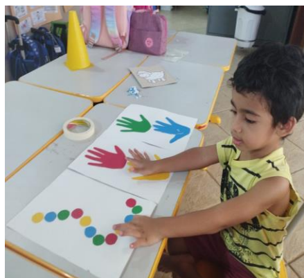
Atividade 5: Identificando as cores