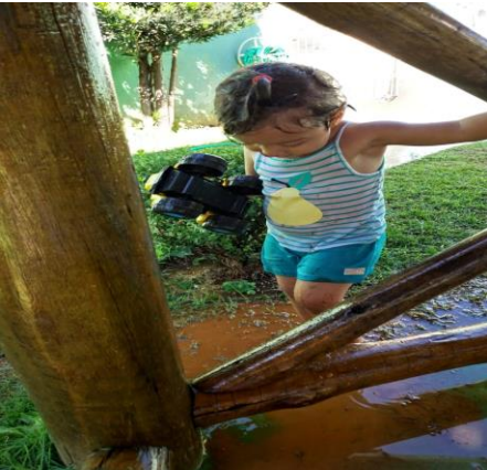
Atividade 1: Brincadeira livre com água