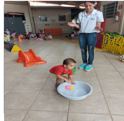
Atividade 3: Circuitos da psicomotricidade corporal