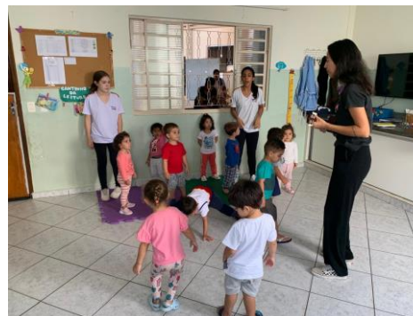
Atividade 3: Todo mundo aprende/Projeto Aprendendo através da música