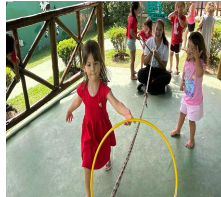
Atividade 3: Corrida do bambolê sobre a corda