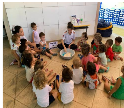
Atividade 7: Oficina da massinha