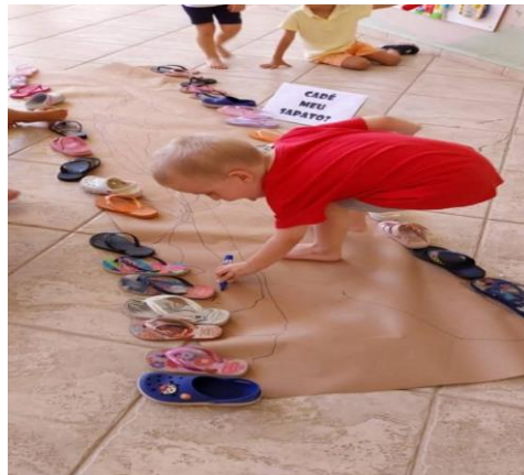
Atividade 2: Cadê meu sapato – Identificando os sapato