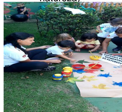
Atividade 7; Pintura com texturas(elemento da natureza)