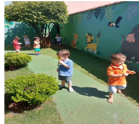
Atividade 3: Brincadeira livre no quiosque(Sala ambiental)