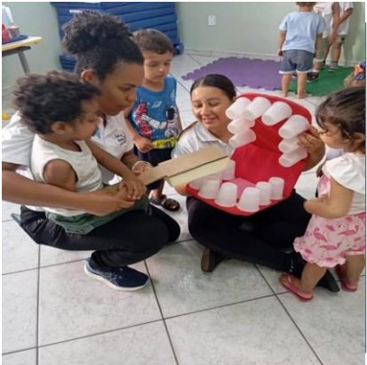
Atividade 1: Estimulo a escovação